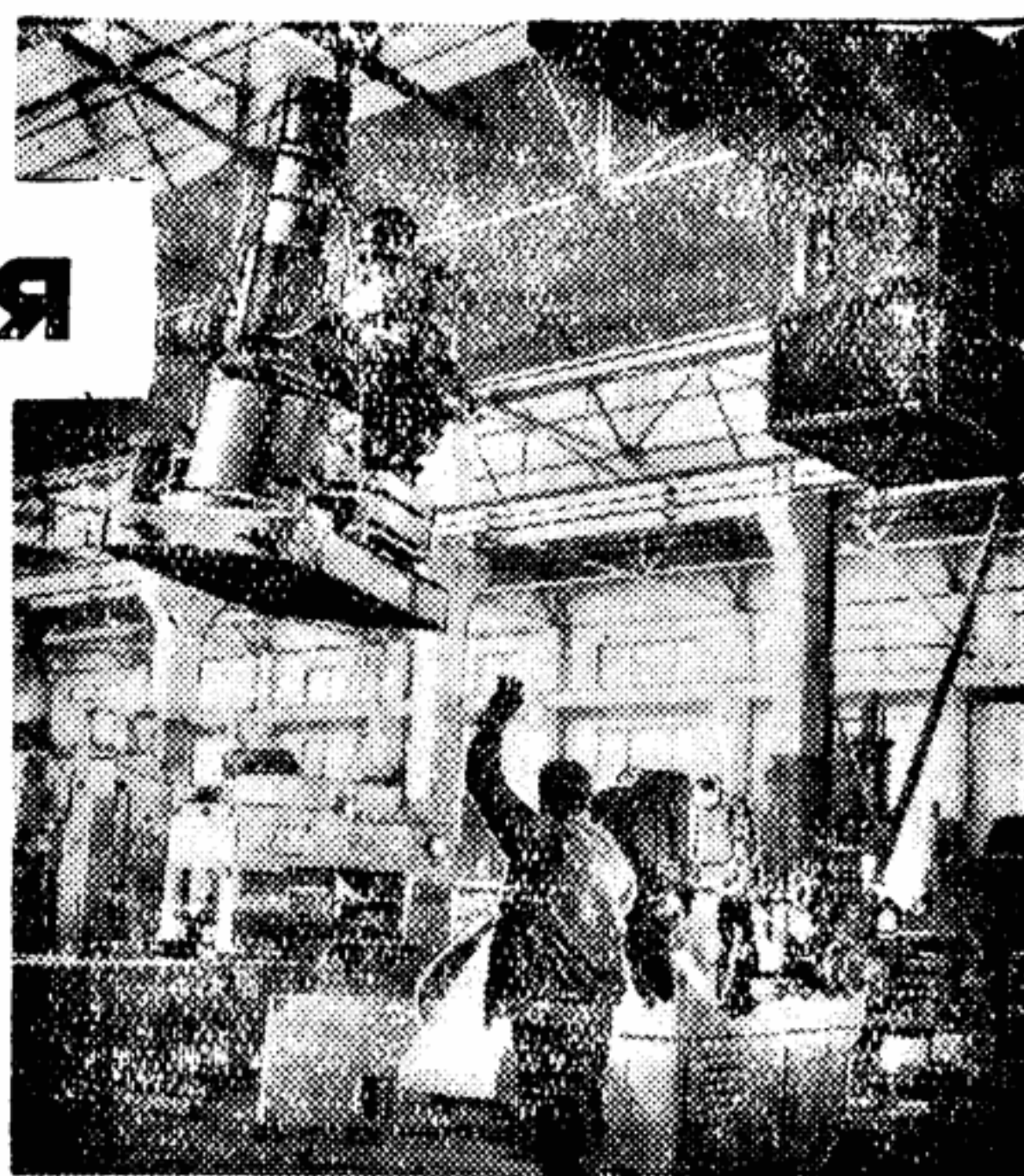
В одном из цехов строящегося в Китае первого автомобильного завода