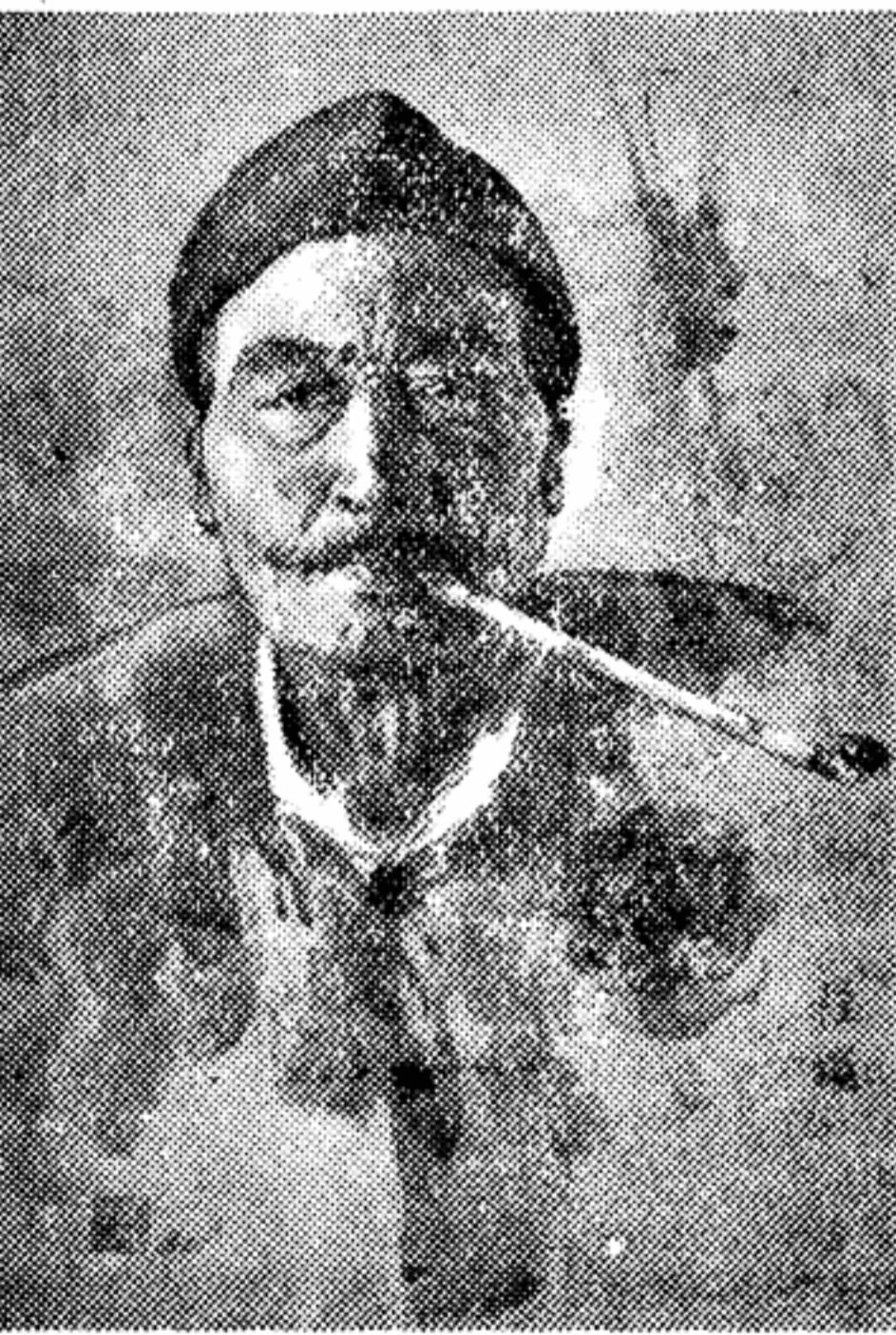
Портрет китайского крестьянина

Лео АМОН, французский сенатор. 1955 год.